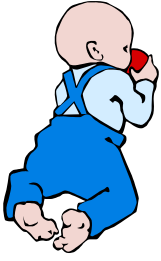
Tabla de Objetivos Alcanzados del Habla y Lenguaje